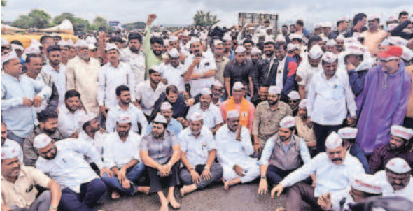
शक्तिपीठविरोधात कोल्हापुरात मंगळवारी पुणे –बंगळूर राष्ट्रीय महामार्गावर आंदोलन करण्यात आले.

शेतकऱ्यांचे १२ जिल्ह्यांत आंदोलन; जमीन मोजणीस आक्षेप