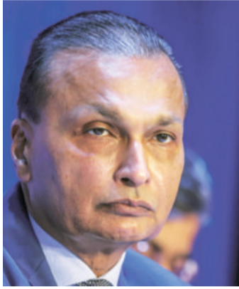
AGENCY HAD SUMMONED RELIANCE GROUP CHAIRMAN ANIL AMBANI FOR QUESTIONING ON AUGUST 5

The money-laundering case stems from at least two CBI FIRs and reports shared by the National Housing Bank, Sebi, National Financial Reporting Authority (NFRA), and Bank of Baroda with the ED.