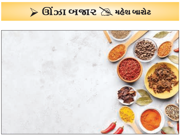
કારણે નિકાસ કામકાજ વધ્યા હતા પરંતુ ચાલુ વર્ષે દેશાવરોની માપની ઘરાકીના કારણે ઘટ્યા મથાળે ભાવ જળવાયેલા છે. આ જોતાં નજીકના સમયમાં ભાવ વધે તેમ નથી. જીરામાં વાચદા આધારે હાજરના ભાવમાં વધવટ થાય છે વધે તેમ નથી.

વધુ ખપત થઈ હતી. જેના કારણે આ વર્ષે ચીજોના ભાવો નીચા હોવા છતાં પરદેશની માંગ ઓછી હોવાનું કહેવાય છે. આગળ ઉપર વાચદો વધે અથવા સરો ગુંથાય તો ભાવમાં કંઈટ આવવાની શક્યતા જોવાય છે. મસાલાની ચીજ વરિયાળીની આવક એવરેજ પાંચેક હજાર ગુણીની છે પરંતુ ઘરાકી ઓછી રહેતાં ભાવમાં નરમાઈ ચાલુ રહી છે. વધ્યા ભાવમાં ખાસો ઘટાડો થયો છે છતાં ઘરાકીના ટેકો મળતો નથી. લોકલ ઘરાકી મંદ છે અને પરદેશની નવી પ્રીમાન્ડ નથી. જેથી ભાવનું વલણ ઘટાડા તરફી રહ્યું છે. ઔષધિય પાક ઈસબગુલની આવક સાથે ઘરાકી ઓછી છે. નિકાસકારોની મર્યાદિત લેવાલી છે. બજારમાં વેચવાલીનું પ્રેસર છે એટલે ભાવ નરમ છે. પાછલા વર્ષે પાકના વધારે ઉત્પાદનથી ભાવ ઘટી ગયા હતા જેના