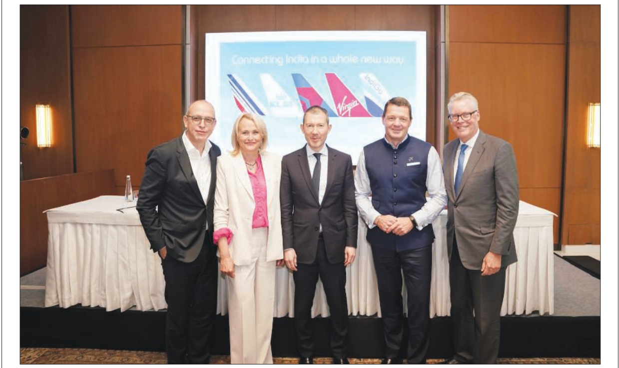
દિલ્હીમાં ઇન્ટરનેશનલ એર ટ્રાન્સપોર્ટ એસોસિએશન (આઇએટીએ)ની ૮૫મી વાર્ષિક સામાન્ય સભા દરમિયાન ભાગીદારીની જાહેરાત કરવામાં આવી હતી. આ જોડાણ આંતરરાષ્ટ્રીય કનેક્ટિવિટીને મજબૂત બનાવવા અને ત્રણેય પ્રદેશોના ડાનબંધ શહેરો વચ્ચે મુસાફરીને સુવ્યવસ્થિત કરવા માટે તૈયાર છે.