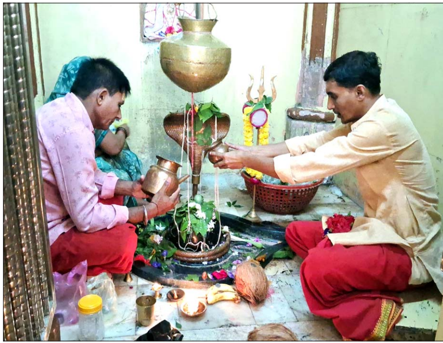
નીલકંઠ મહાદેવ મંદિરે શ્રદ્ધાળુઓએ દૂધ અને જળનો અભિષેક કર્યો હતો.

મોડાસા, તા.૪ તિજોરીમાંથી ચાંદીના છડા-૧૭ ભિલોડા તાલુકાના રીટોડા ગામે તોલાના કિંમત રૂ.૮૦૦૦/-, એક બંધ મકાનમાં તસ્કરો ત્રાટક્યા ચાંદીના કમર રૂ.૩૧-૨ હતા. ઘરના દરવાજાનું લોક તોડી રૂ.૧૩,૦૦૦/- મળી કુલ અંદર પ્રવેશ કરીને ચોરીને અંજામ રૂ.૨૨,૦૦૦/- મત્તાની ચોરી આપ્યો હતો. ઘરમાં રખાયેલ તિજોરીમાંથી બે લાખ રૂપિયા ભિલોડા પોલીસ મથકે મકાન રોકડા તથા એક માલિકે ચોરીની સોનાનો સેટ, પોલીસે ગુનો નોંધી ક રિ ય ૧ ૬ ચાંદીના છડા નોંધાવી હતી. મળી આશરે તસ્કરોને પકડવા બંને ચોરી રૂ.૨,૮૦,૦૦૦/ ચકો ગતિમાન કર્યા િભ લો ડ ૧ ની મત્તાની ચોરી તાલુકાના બંધ કરી તસ્કરો પલાયન થઈ ફરાર મકાનમાં થઈ હતી. પોલીસે થઈ ગયા હતા. આ બનાવ અંગે તસ્કરોને ઝડપવાના ચકો મકાન માલિક બાબુભાઈ દીતાજી ગતિમાન કર્યા છે.