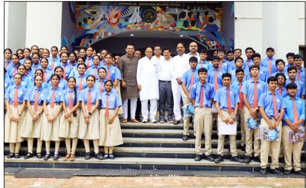
હિંમતનગર એપીએમસી ફાર્મસી કોલેજમાં "ફામાં યાત્રા"નું આયોજન કરવામાં આવ્યું હતું. હિંમતનગરની શાળાના ધોરણ ૧૧ અને ૧૨ના વિદ્યાર્થીઓને ફાર્મસીનું પ્રેક્ટિકલ જ્ઞાન મળી રહે તેમજ આવનાર સમયમાં તેઓ યોગ્ય કારકિર્દી પસંદ કરી શકે તે હેતુથી કોલેજની મુલાકાત કરાવવામાં આવી. આ પ્રસંગે ધારાસભ્ય વી. ડી. ઝાલજી વગેરે હાજર રહ્યા હતા.

મોડાસા, તા.૪ અરવલ્લી જિલ્લા અને સાબરકાંઠા જિલ્લામાં દશામાંના ૧૦ દિવસનું વ્રત પૂર્ણ થયું છે. દશામા માતાજીના મંદિરે ભક્તોએ માતાજીની મૂર્તિનું ગરબાના આયોજન કરવામાં વાજતે-ગાજતે વહેતા પાણીમાં આયું હતું. જ્યાં ભક્તો ગરબે વિસર્જન કર્યું હતું. આમ ભક્તોએ શ્રદ્ધા અને આસ્થાભરે દશામા વિસર્જન કરાયુ દશામાં મૂર્તિની વળામણ કર્યા હતા. સ્થાપના કર્યાના ૧૦ દિવસ સુધી દિવાસાના દિવસે ભક્તોએ દશામાની મૂર્તિ ખરીદીને વાજતે-ગાજતે ગૃહ પ્રવેશ કરાવી સ્થાપન કર્યું હતું. બંને જિલ્લામાં નદી કિનારે અને તળાવ કિનારે વહેલી સવારથી શ્રદ્ધાળુઓની ભીડ ઉમટી પડી હતી. સવારે અને સાંજે દશામા આરાધના કરવામાં આવી હતી. દશામા માતાજીના મંદિરે ગરબાના આયોજન કરવામાં આયું હતું. જ્યાં ભક્તો ગરબે વિસર્જન કર્યું હતું. આમ ભક્તોએ શ્રદ્ધા અને આસ્થાભરે દશામા વિસર્જન કરાયુ દશામાં મૂર્તિની વળામણ કર્યા હતા. સ્થાપના કર્યાના ૧૦ દિવસ સુધી દિવાસાના દિવસે ભક્તોએ દશામાની મૂર્તિ ખરીદીને વાજતે-ગાજતે ગૃહ પ્રવેશ કરાવી સ્થાપન કર્યું હતું. બંને જિલ્લામાં નદી કિનારે અને તળાવ કિનારે વહેલી સવારથી શ્રદ્ધાળુઓની ભીડ ઉમટી પડી હતી.