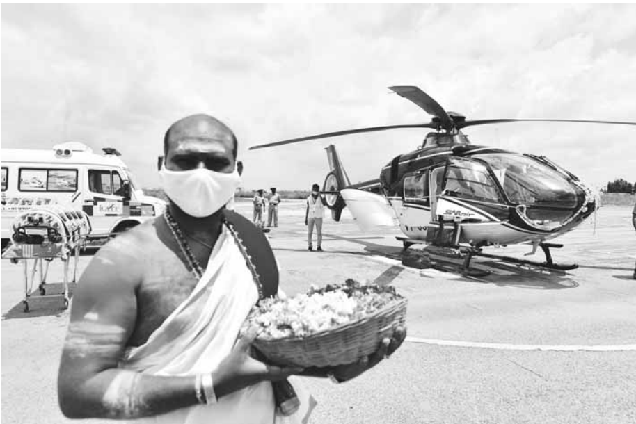
बेंगलुरु में आधुनिक चिकित्सकीय सुविधाओं युक्त एयर एंबुलेंस के उद्घाटन के लिए कर्नाटक के मुख्यमंत्री बीएस येदियुरप्पा की प्रतीक्षा करता पुजारी

समर्थकों सहित कांग्रेस में शामिल होने के बाद कमलनाथ ने संवाददाताओं से कहा, मध्य प्रदेश का मतदाता बहुत समझदार है। मुझे राज्य के मतदाताओं पर पूरा भरोसा है।।जिन 27 सीटों पर उप चुनाव होने हैं, वहां मतदाता कमलनाथ या कांग्रेस का समर्थन नहीं कर सकते हैं लेकिन वे अवश्य सच्चाई का समर्थन करेंगे। कमलनाथ ने कहा कि सर्वश्रेष्ठ रिपोर्ट बहुत ही अच्छी हैं और हम चिंतित नहीं हैं। हम सभी सीटें जीतेंगे। उन्होंने कहा कि बड़ी संख्या में भाजपा कार्यकर्ता कांग्रेस में शामिल हो रहे हैं। उन्होंने कहा, न केवल जनता, बल्कि भाजपा कार्यकर्ता भी उनसे (वर्तमान शासन व्यवस्था) से नाखुश है। इससे पहले छतरपुर जिले की बड़ा महलरा विधानसभा सीट के प्रमुख नागरिकों का एक समूह कांग्रेस में शामिल हुआ था। कांग्रेस के 25 विधायकों के त्यागपत्र और दो विधायकों के निधन के कारण प्रदेश विधानसभा की रिक्त हुई 27 विधानसभा सीटों पर उप चुनाव होने हैं हालांकि चुनाव आयोग ने फिलहाल उप चुनाव का कार्यक्रम घोषित नहीं किया है।