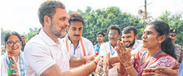
Rahul Gandhi being felicitated during a public rally for the Bihar Assembly polls, in Banka district, Bihar

Gandhi, addressing an election rally in Banka, also asserted that the Congress produced evidence of “vote chori” (vote theft) in the Haryana polls, and the Election Commission cannot deny the charges.