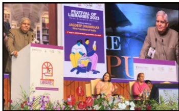
Good evening! My Draupadi Murmu ji has

I come to a function, I go to social media, which these days is enormously important, I get in touch with the people who know about it. I'm happy to communicate with the Honourable Minister and the Secretary that good vibes have been generated all around by this function.