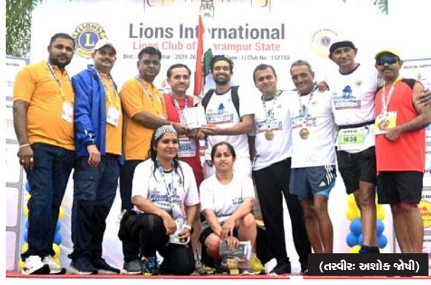
દોડવાનો દોડવીરોને અનોખો અને યાદગાર અનુભવ મળ્યો હતો. વરસાદ વચ્ચે દોડવીરોએ ગરબા રમવાનો આનંદ માણ્યો હતો, જેને કારણે આ મેરેથોન મોજમસ્તી અને ઉત્સાહથી ભરપૂર બની ગઈ હતી. આ મેરેથોનને સફળ બનાવવામાં લાયન્સ ક્લબ ઓફ ધરમપુર સ્ટેટ તેમજ સર્વે સપોર્ટ ક્લબ વલસાડની ટીમે ભારે જહેમત ઉઠાવી હતી.