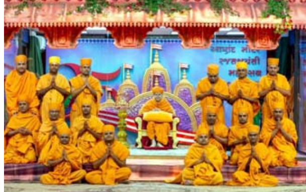
સતપુરુષનો સુવર્ણ સ્પર્શ” સૂત્ર ચરિતાર્થ થયું. જે પરિપ્રેક્ષામાં. ૮ ઓગસ્ટ, ૨૦૨૫ શનિવારે- રક્ષાબંધનના પવિત્ર પર્વે સવારે સ્વામીશ્રીની પ્રાતઃપૂજા અને સાંજે આણંદ મંદિર રજત જયંતિ મહોત્સવની અભૂતપૂર્વ ઉજવણીમાં સૌ પ્રથમ આણંદના ગૌરવવંતા ઈતિહાસને પૂજ્ય અનિર્દેશદાસ સ્વામીએ પ્રવચનના માધ્યમ થી રજૂ કર્યો હતો. કાર્યક્રમના અંતમાં સદગુરુ સંત પરમ પૂજ્ય ત્યાગવલ્લભ સ્વામીએ સ્વામીશ્રી સમક્ષ પ્રાર્થના રજૂ કરી હતી. ત્યારબાદ સમૂહ આરતીનો સૌએ લાભ લીધો હતો.

(પ્રતિનિધિ) આણંદ, તા. ૮ ઓગસ્ટ, ૨૦૨૫ શનિવારે સાંજે ૫ થી ૮ દરમિયાન આણંદ અક્ષરકર્મ બી.એ.પી.એસ.ના ગૌરવવંતા ઈતિહાસ સાથે આણંદ મંદિર રજત જયંતિ મહોત્સવની અભૂતપૂર્વ ઉજવણીનું સાક્ષી બન્યું હતું. ડિસે. ૨૦૦૦માં બ્રહ્મ સ્વરૂપ શ્રી પ્રમુખ સ્વામી મહારાજ આણંદ બી.એ.પી.એસ. સત્સંગ મંડળને ગોધા તળાવ પાસે શિવરખદ મંદિરની ભેટ આપી હતી જે અભૂતપૂર્વ ઘટના ને ૨૫ વર્ષ પૂર્ણ થતાં હોઈ વર્ષ ૨૦૨૫ “આણંદ મંદિર રજત જયંતિ વર્ષ” તરીકે ઘોષિત કરવામાં આવ્યું હતું. સોનામાં સુગંધ ભળે તેમ પ્રગટ બ્રહ્મ સ્વરૂપ શ્રી મહંત સ્વામી મહારાજનું આણંદ શહેરને સાનિધ્ય પ્રાપ્ત થતાં “આણંદ મંદિર રજત વર્ષ-