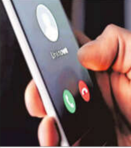
A revamped MyCall app will be launched by March, which will allow users to report call drops, muting and voice distortion

To tighten enforcement, Trai has expanded the scope of complaints to include unregistered