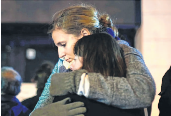
Women hug in front of the Bataclan concert hall in Paris

The restaurant has been re-named Les Ogres ever since. The third and the bloodiest attack occurred at the Bataclan concert hall, where American rock band Eagles of Death Metal was performing where 90 people were massacred and dozens more seriously wounded as terrorists opened fire on the crowd and took hostages. The siege ended