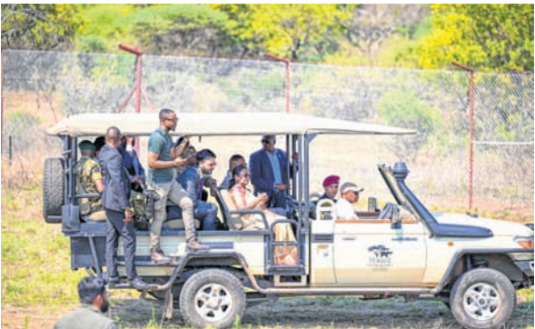
President Droupadi Murmu with Botswanas President Duma Gideon Boko during the release of cheetahs at a nature reserve in Gaborone, Botswana.

President Droupadi Murmu addressed the Indian community in Gaborone on Thursday, highlighting the longstanding ties between India and Botswana and the growing cooperation reflected during her ongoing