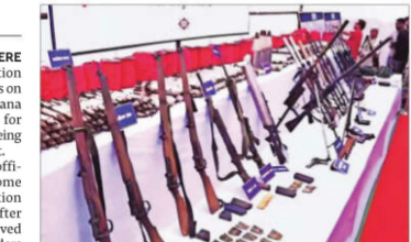
Arms and ammunition seized by security forces during an anti-Naxal operation in the Kargettuga hills put on display in Bijnapur, Chhattisgarh, on Wednesday