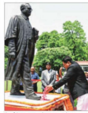
(Left) A young lawyer takes a selfie with Chief Justice of India BR Gavai; CJ Gavai pays floral tribute to BR Ambedkar on the Supreme Court premises on Wednesday

said, "His recommendation, in no way, is to be misconstrued to mean that three senior-most Judges from Bombay High Court (two of whom are serving as Chief Justices) are less suitable than Justice Gavai.