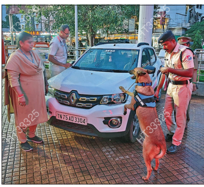
கோவை ரயில் நிலைய வளாகத்தில் நிறுத்தப்பட்ட வாகனங்களை மோப்ப நாய் உதவியுடன் சோதனை செய்த ரயில்வே போலீஸார். (அடுத்தபடம்) கோவை உக்கடம் பேருந்து நிலையத்தில் இருந்து கோவை செல்லும் பேருந்தில் ஏற முண்டியடித்த பயணிகள். (கடைசி படம்) திருப்பூர் மத்திய பேருந்து நிலையத்தில் நேற்று மாலை திரண்ட வாகனங்கள்.

திருப்பூர் மாவட்ட ஆட்சியர் மனிஷ் நாரணவரே தெளிவிட்டுள்ள செய்திக்குறிப்பு: அரசு அலுவலகங்களில் ஆட்சிமொழித் திட்ட செயலாக்கம் விரைவாகவும், முழுமையாகவும் நடைபெற துணைபுரியும் வகையில், அனைத்துத் துறை அலுவலர் மற்றும் பணியாளர்களுக்கு 2025-2026-ம் நிதியாண்டில் ஆட்சிமொழி பயிலரங்கம் மற்றும் கருத்தரங்கம் நடத்த அரசு ஆணையிட்டுள்ளது. அதன்படி திருப்பூர் மாவட்டத்தில் அரசு அலுவலகங்களில் பணிபுரியும் அலுவலர் மற்றும் பணியாளர்களுக்கு ஆட்சிமொழி பயிலரங்கம், கருத்தரங்கம் வரும் 20 மற்றும் 21-ம் தேதி ஆகிய 2 நாட்கள் காலை 10 மணி முதல் மாலை 5.45 வரை ஆட்சியர் அலுவலகத்தின் கூட்ட அரங்கில் நடைபெற உள்ளது. இப்பயிலரங்கங்களில் தமிழ் வளர்ச்சி இயக்குநர், மாவட்ட ஆட்சியர், மாவட்ட வருவாய் அலுவலர், தமிழ் வளர்ச்சித் துறை இயக்குநர்கள், தமிழறிஞர்கள் உட்பட பலர் பங்கேற்று பேச உள்ளனர். பயிலரங்கில் பங்கேற்பவர்களுக்கு ஆட்சிமொழி வாரலாறு, சட்டம், ஆட்சிமொழி செயலாக்கம், அரசாணைகள், ஆட்சிமொழி ஆய்வு, மொழிப்பயிற்சி ஆகிய தலைப்புகளில் பயிற்சி அளிக்கப்பட உள்ளது. ஒவ்வொரு அலுவலகத்திலும் இருக்கும் அலுவலர் நிலையில் அலுவலர் (அ) கண்காணிப்பாளர் ஒருவரும், பணியாளர் நிலையில் உதவியாளர் (அ) இராஜிதம் உதவியாளர் (அ) தட்டச்சர் ஒருவருமாக மொத்தம் 2 பேர் கலந்து கொள்ளலாம், என கூறப்பட்டுள்ளது.