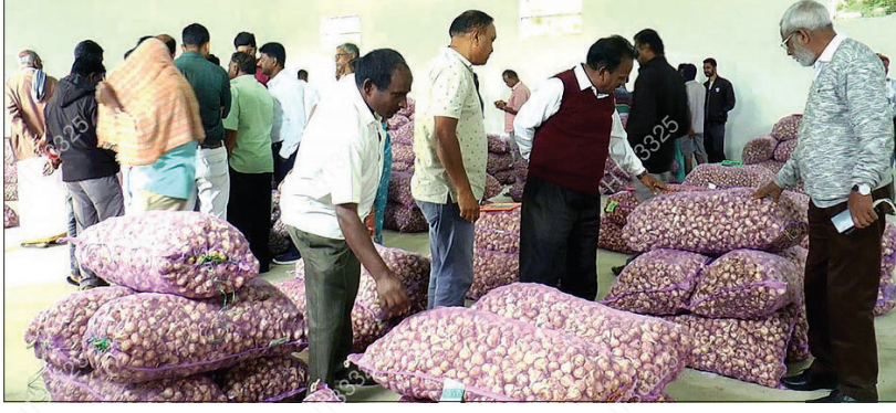
குன்னூர் எடப்பள்ளி ஒருங்கிணைந்த வேளாண் மையத்தில் நேற்று நடைபெற்ற ஏலத்தில் பங்கேற்றோர்.

வாயிலாக திறந்து வைத்தார். இந்நிலையில் நேற்று வேளாண் வணிகம் மற்றும் விற்பனைத் துறை சார்பில், ஊட்டி பூண்டு முதல்முறையாக ஏலம் விடப்பட்டது. முதல் நாளிலேயே உயர் ரக பூண்டு கிலோ ரூ.200 வரை ஏலம் போனது. இடைத்தரகர்கள் இல்லாமல் நேரடியாக விவசாயிகள் மட்டுமே கலந்து கொண்டதால், வாய் கிடைத்ததாக விவசாயிகள் தெரிவித்தனர். வியாபாரத்தோறும் நடைபெறவுள்ள ஏலத்தில் விவசாயிகள் கலந்து கொண்டு பயன்பெறலாம் என குன்னூர் ஒருங்கிணைந்த வேளாண் மைய அதிகாரிகள் தெரிவித்தனர்.