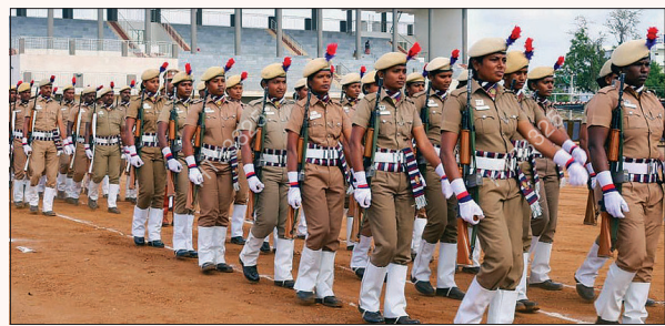
திருப்பூர் சிக்கண்ணா அரசு கலைக்கல்லூரியில் நேற்று சுதந்திர தின அணிவகுப்பு ஒத்திகையில் ஈடுபட்ட போலீஸார்.