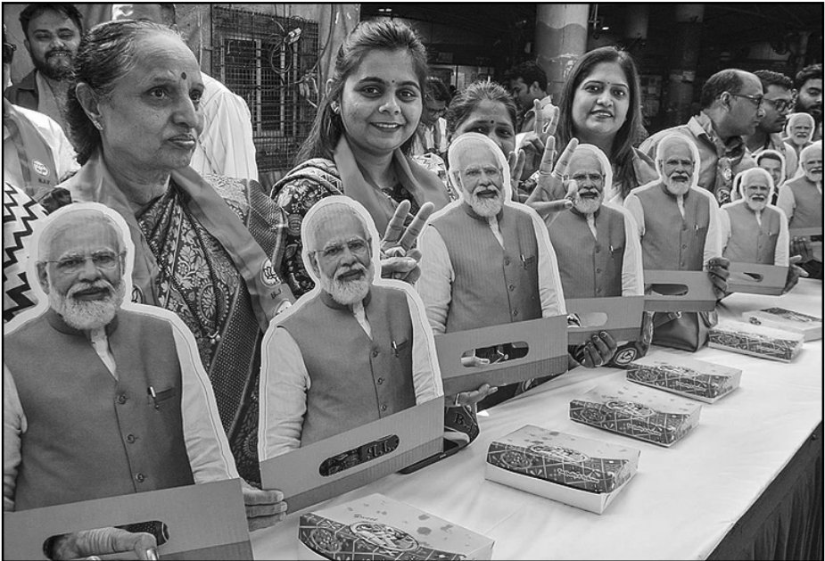
BJP workers celebrate the NDA's strong lead in the Bihar Assembly election, at the party office, in Thane on Friday,