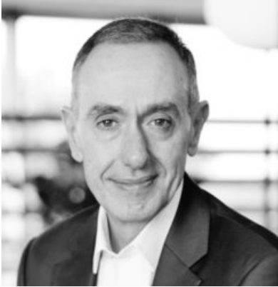
CEO Elie Maalouf said IHG’s total number of hotels in India could reach well above 1,000 in the long term

For the group, the Indian outbound traveller market is also becoming increasingly important to cater to, as it is among