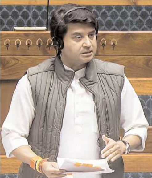
दूरसंचार मंत्री ज्योतिरादित्य सिंधिया लोकसभा को संबोधित करते हुए।

ग्रामीण और सुदूर क्षेत्रों में कनेक्टिविटी की समस्या के संबंध में द्रमुक सदस्य कलानिधि मारन के पूरक प्रश्नों का उत्तर देते हुए सिंधिया ने कहा कि ऐसे क्षेत्रों में सेटलाइट कनेक्टिविटी की ज़रूरत है, जहां सामान्य दूरसंचार संभव नहीं है। उन्होंने