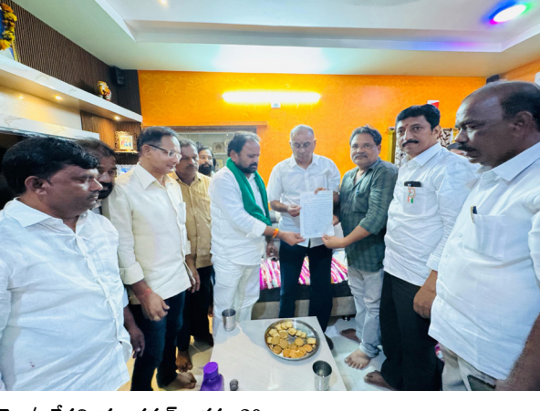
వైసా/కారేపల్లి ప్రజాదర్శన ఆగస్టు 20