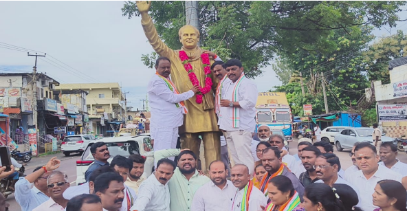
భూపాలపల్లి ప్రజాదర్శన ప్రతినిధి ఆగస్టు 20.

సాంకేతిక రంగానికి పుణిది వేసిన గొప్ప నాయకుడు ప్రపంచదేశాల్లో దేశాన్ని బలమైన దేశంగా చేయడానికి కృషి ప్రజాస్వామ్య దేశానికి పంచాయతీ రాజ్ సంస్థలు అవసరమని గుర్తించి వాటిని తీర్చిదిద్దిన గొప్ప నాయకుడు భూపాలపల్లి జరిగిన రాజీవ్ గాంధీ జయంతి వేడుకల్లో ఎమ్మెల్యే గండ్ల సత్యనారాయణ రావు