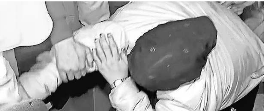
The woman was removed from India Gate when she protested against the court order on Tuesday.

Speaking to The Indian Express in the evening, the survivor said the development "will only make things worse for victims who decide to take