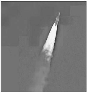
ISRO launches LVM3-M6 into orbit in Sriharikota on Wednesday.

INDIA'S HEAVIEST launch vehicle LVM-3, in its third commercial mission, placed US communication satellite Bluebird Block-2 in a precise orbit early Wednesday morning. Weighing around 6,100 kg, it was the heaviest satellite launched by an Indian rocket.