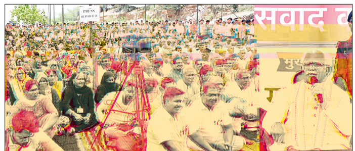
नारनौल। मंडलाना में जन संवाद करते सीएम मनोहरलाल।

लॉजिस्टिक हब व आईएमटी से बढ़ेंगे रोजगार के अवसर