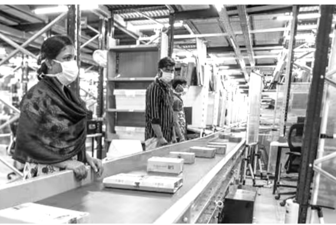
विचक-कॉमर्स में निवेश को रफ्तार देने और डिजिटल पहुंच का विस्तार करने के वास्ते वैश्विक आपूर्ति श्रृंखला की विशेषज्ञता का लाभ उठाने के लिए पिलपकार्ट का समर्थन कर रही है खुदरा क्षेत्र की दिग्गज कंपनी