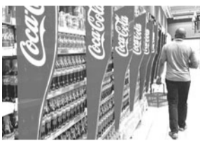
बाधाएं उतनी बड़ी नहीं हैं मगर बने रहना और पैमाना बढ़ाने की बाधाएं काफी अधिक हैं।

मात्रा के लिहाज से कोका-कोला के लिए भारत पांचवां बड़ा बाजार है। ब्रॉन ने कहा कि इसमें भिन्नता हो सकता है मगर भारत बढ़ती मांग वाला बाजार बना है और उद्योगों को लगातार बढ़ रहा है। उन्होंने कहा, 'अलग-अलग आधार हैं, लेकिन मांग सृजन का मौका अभी भी मौजूद है।' क्षेत्र में बढ़ती प्रतिस्पर्धा पर ब्रॉन ने कहा कि हमारे देश विकासशील और जीवंत उद्योग में हमेशा नई कंपनियां बाजार में आएंगी। उन्होंने कहा, 'प्रवेश की