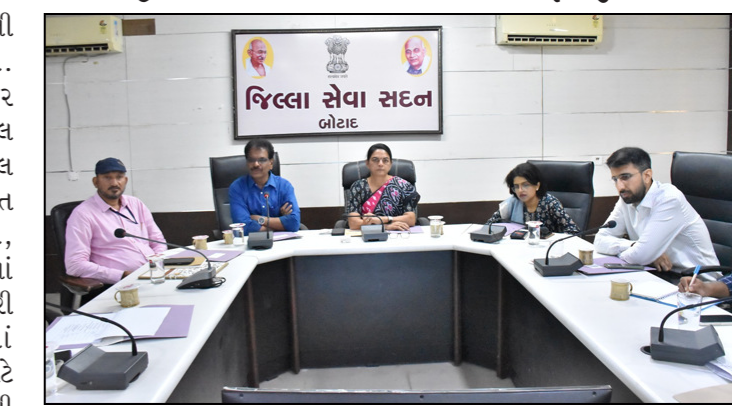
ચાઈલ્ડ લેબર એક્ટના બેનર મુકવા તથા લેબર ઓફિસ દ્વારા નિયમિત આકસ્મિક મુલાકાત કરવા સાથે બોટાદને ચાઈલ્ડ લેબર મુક્ત જિલ્લો બનાવવાનાં સંકલ્પ સાથે કામગીરી કરવા પર ભાર મુક્યો હતો.

બોટાદમાં બાળકોનાં પુન:વસનની કામગીરીની સરાહના કરી હતી. તેમણે બેઠકમાં ચાઈલ્ડ વેલ્ફેર કમિટીની કામગીરી, જુવેનાઈલ જસ્ટિસ એક્ટ તથા સ્પેશિયલ જુવેનાઈલ પોલીસ યુનિટ અંતર્ગત પોક્સો, બાળ લગ્ન, બાળ મજૂરી, ભિક્ષાવૃત્તિ, બાળ તસ્કરી સહિતનાં કેસ નિકાલની સ્થિતિ અંગે જાણકારી મેળવી પાસ કરીને બાળકોમાં ગુનાખોરી, બાળ લગ્ન ન થાય તે માટે જાગૃતિ કાર્યક્રમ યોજવા સુચના આપી હતી. બોટાદમાં બાળ મજૂરી અંગે વિગતો મેળવીને તેને રોકવા માટે રેસ્ટોરેન્ટ, હોટેલ સહિતનાં સ્થળે