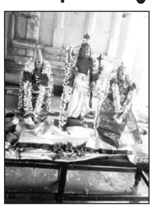
சுவாமி அருள்பாலித்தார். அப்போது கூடியிருந்த பக்தர்கள் கோவிந்தா... கோவிந்தா... என்று பக்தி கோஷம் எழுப்பி, சுவாமியை தரிசனம் செய்தனர். இந்த நிகழ்ச்சிக்கான

வலங்கைமான், டிச. 31- திருவாரூர் மாவட்டம் வலங்கைமான் வரதராஜ பெருமாள் கோவிலில், வைகுண்ட ஏகாதசி விழாவை முன்னிட்டு சொர்க்கவாசல் திறப்பு நிகழ்ச்சி நடைபெற்றது. முன்னதாக, வரதராஜ பெருமானுக்கு சிறப்பு அபிஷேக அலங்காரங்கள், மகா ஆராதனைகள் நடைபெற்றன. தொடர்ந்து, சிறப்பு அலங்காரங்களுடன், மங்கல இசைகள் முழங்கி கோவிலின் சொர்க்கவாசல் திறக்கப்பட்டது. இதில் சர்வ அலங்காரத்துடன் பக்தர்களுக்கு